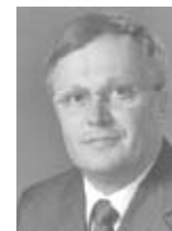
Christian Bernard, ein gebürtiger Franzose, ist seit 1990 internationaler Präsident des Rosenkreuzer-Ordens. Dieser Artikel basiert auf Aussagen seines Buches „Rosenkreuzerische Reflexionen“.

Schließlich kommt dem Menschen im Kosmos eine besondere Aufgabe und Stellung zu, und es wird Zeit, dass die Menschheit auf individueller und kollektiver Ebene ihrer kosmischen Verantwortung gerecht wird - zum Wohle der gesamten Menschheit. ■